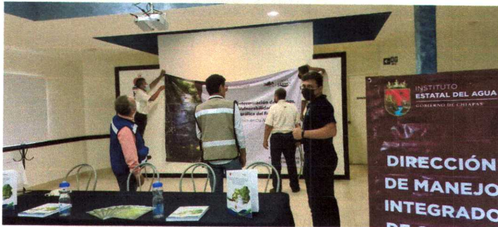
Preparación de materiales y mobiliario del salón para el evento de presentación del Estudio del Rio Chacamax.